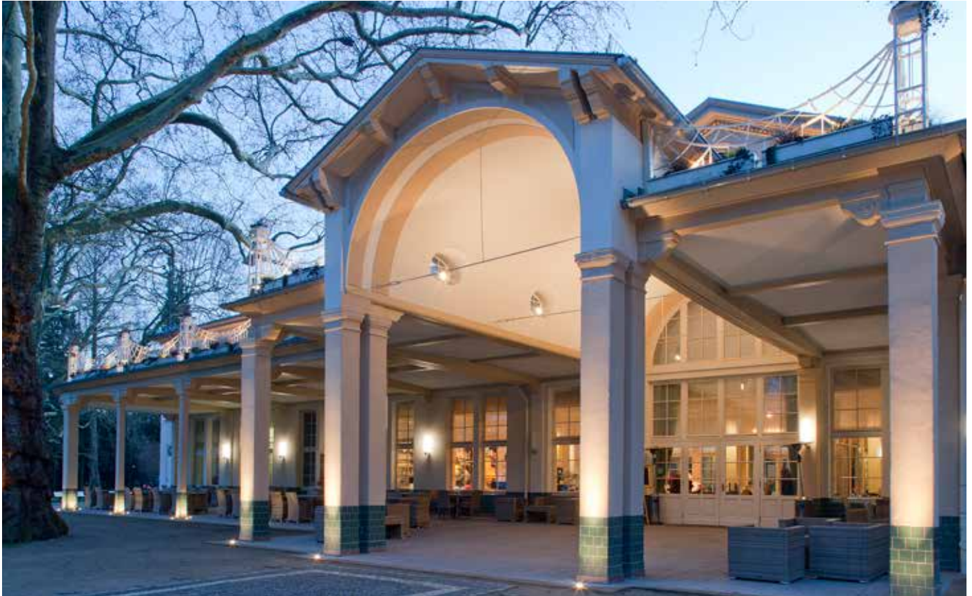
Bei der Sanierung der Orangerie in Bad Homburg kamen Produkte von Siniat zum Einsatz.

Alles aus einer Hand für mehr Sicherheit in Feucht- und Nassräumen