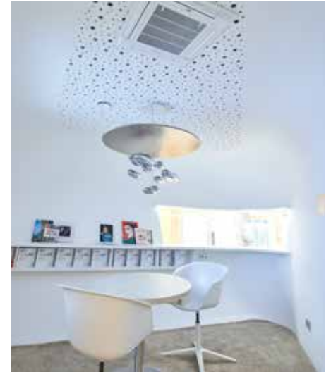
Für eine gute Raumakustik und -klimatisierung sorgt das Deckenelement Knauf Cleaneo Akustik mit integrierter Lüftung über dem Beratungstischchen.

E ine dreidimensionale Sonderkonstruktion von Knauf bildet das Herzstück im modernen Raumkonzept innovativer Kieferorthopädiezentren.