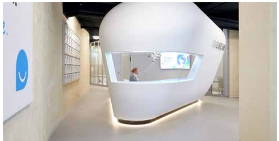
Das Infocenter inmitten des lichten, großzügigen Raumes im smilike.me-Zentrum in Hamburg ist eine Sonderanfertigung von Knauf.

In dem schallgedämmten, kokonartigen Centerpiece finden in angenehmer Atmosphäre lockere Beratungsgespräche und Präsentationen mit modernen Informationsmedien statt. „Wir hatten nur neun Quadratmeter Grundfläche für das Raum-in-Raum-Objekt zur Verfügung. Also tüftelten wir verschiedene 3-D-Modelle aus und entschieden uns für die ovale Form mit organischen