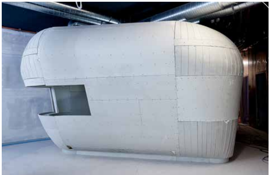
Objektbericht: Trockenbau kann auch rund – futuristisches Infocenter in Hamburg