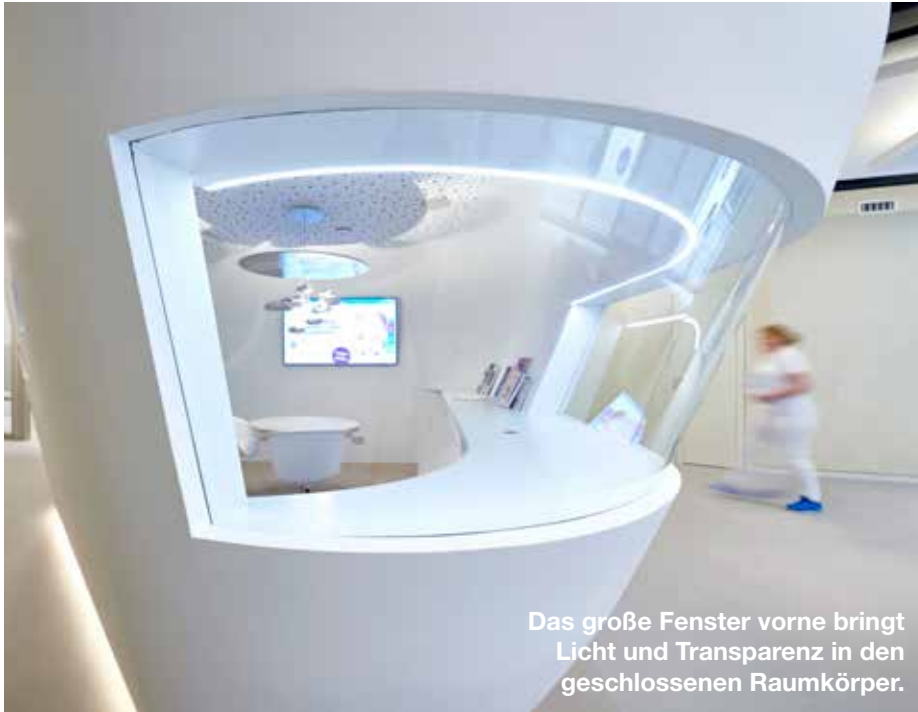
Das große Fenster vorne bringt Licht und Transparenz in den geschlossenen Raumkörper.

Trockenbau formt Raumsulptur im smilike.me-Zentrum Hamburg