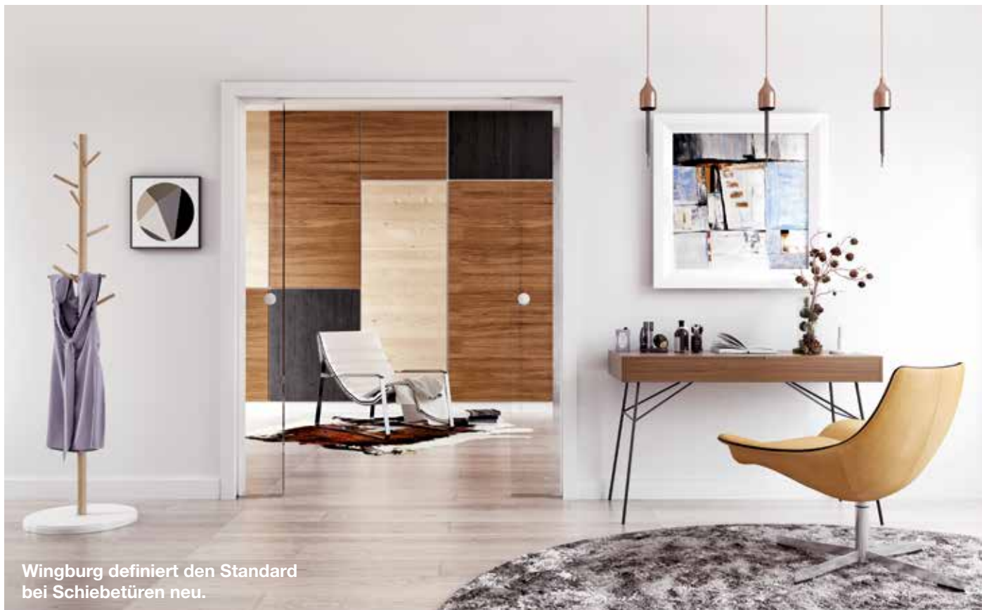
Wingburg definiert den Standard bei Schiebetüren neu.